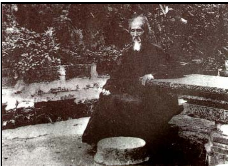
El Gran Maestro Hsu Yun (Nube Vacía), es considerado el más grande Maestro Ch'an del Siglo 20.

uno mismo. Las impurezas de la mente son, los pensamientos erróneos y los apegos. La naturaleza-propia es la sabiduría y la virtud del Tathagata [Buddha]. La sabiduría y la virtud de los Buddhas y seres sintientes no son diferentes de unos a otros. Para experimentar esta sabiduría y esta virtud, deje atrás la dualidad, la discriminación, el pensamiento erróneo y el apego. Esto es la Buddheid ". – Nube Vacía.