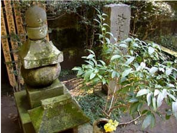
Tumba de Daisetz Teitaro Suzuki (1870-1966). D.T. Suzuki es conocido por su introducción del Buddhismo Zen al Occidente, debido en gran parte, a su habilidad para sortear con éxito a través de sus perspicaces escritos, la división cultural Oriente/Occidente.

tiempo que el Zen entró en escena en Japón, los Buddhistas Japoneses ya habían tenido una historia de más de 500 años.