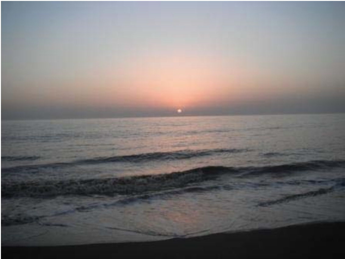
De las Drogas al Dharma Siguiendo la Huella Hippie Hasta el Camino Budista